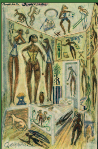
Ovartaci befolkede sin sengestue på hospitalet med sine karakteristiske væsener. Billedet giver et indtryk af, hvordan Ovartaci ønskede at udsmykke hospitalet til glæde for patienter og personale.