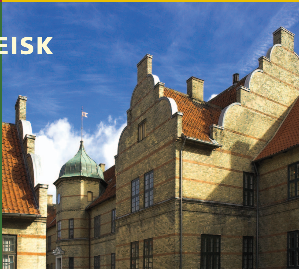
Hospitalsarkitektur: Michael Gottlieb Bindsbølls karakteristiske gotiske trappegavl, gule sten og røde murstensbånd er detaljer i hans historicistiske hospitalsbyggeri til glæde for øje og sind hos syge og raske.

– Samarbejdet er døbt "Connecting the European Mind", og den overordnede koordinator på projektet er Museum Dr. Guislain i Gent.